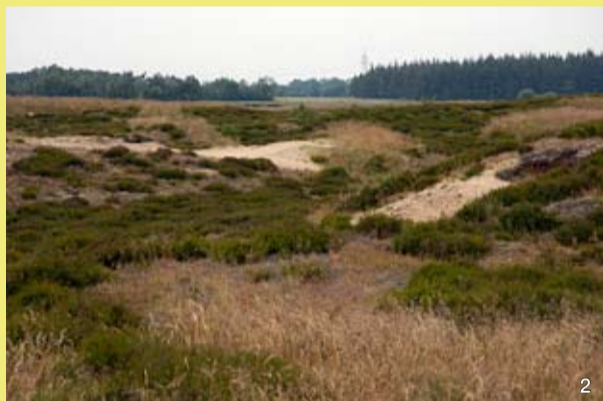
Flache, von Heide bedeckte Hügel und vermoorte Senken bestimmen das Landschaftsbild im Naturschutzgebiet.

NATURA 2000 – Lebensräume erhalten und entwickeln