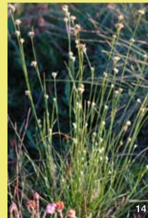
Das Weiße Schnabelried ist eine Art der nassen Moore.