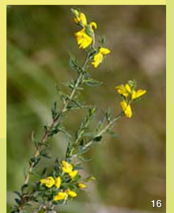
Der Englische Ginster tritt in den trockenen Heiden auf.

Aufgrund der einzigartigen Temperatur- und Trockenheitsbedingungen haben die Heiden und offenen Sandflächen in Schleswig-Holstein eine herausragende Bedeutung für wärme- und trockenheitsliebenden Insekten, zu denen unter anderem seltene Schmetterlinge, Sandlaufkäfer, Grabwespen, Sandbienen oder auch Spinnen gehören. Als bedeutend ist das Vorkommen der sehr seltenen Uralmeise zu bewerten, die hier einen der wenigen Standorte in Schleswig-Holstein hat. Auch inzwischen selten gewordene, bekanntere Arten wie Rebhuhn, Zauneidechse oder Kreuzotter finden hier eines der wenigen noch vorhandenen Rückzugsgebiete.