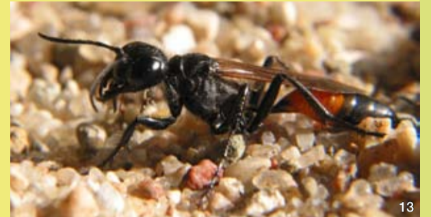
Das Grabwespenweibchen gräbt Röhren in den Sand, in denen sie ihre Larven mit gelähmten Beutetieren füttert.