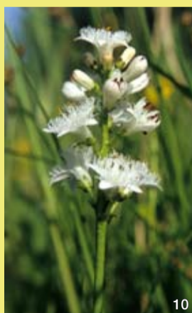
Der Fieberklee findet sich im Torfmoos-Schwinggras.