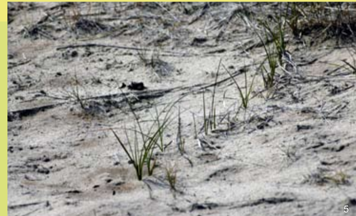
Die Sandsegge, die „Nähmaschine Gottes“, legt mit ihren langen Ausläufern den Dünensand fest.

und die schwer zersetzbare Heide-Streu förderten die Versauerung und Verarmung der Böden und damit die Auswaschung von Mineralstoffen aus dem Oberboden durch den Regen.