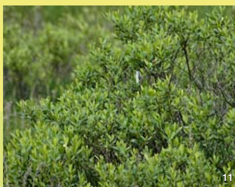
Der Gagelstrauch wurde vor Einführung des Hopfens als Konservierungsmittel für Bier verwendet.