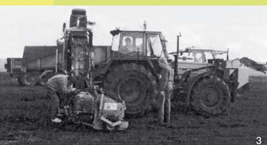
Plaggen mit einer modernen Plagg-Maschine.

Heute kennen wir Dünen eigentlich nur noch von den Küstenregionen an Nord- und Ostsee. Aber es gibt auch im Binnenland Dünen, deren Ursprung auf die Zeit zum Ende der letzten Eiszeit („Weichsel-Vereisung“) zurückgeht. Damals, vor etwa 13.000 Jahren, als die bis zur Linie Flensburg-Schleswig vorgerückten Gletscher weitgehend wieder abgetaut waren, dehnte sich hier eine nur sehr lückig bewachsene Tundra aus. Mit dem Schmelzwasser wurden große Sandmengen nach Westen verfrachtet („Sander“). Die breiten Ströme schnitten sich teilweise tiefer in die Sandflächen ein. Der beständige Wind griff an den Kanten an, wehte den Sand zu Dünen oder Flugsandflächen auf und formte so diese bewegte Dünenlandschaft.