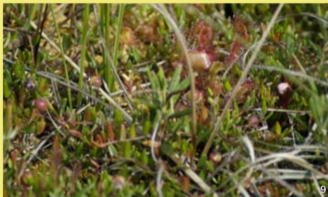
Der Rundblättrige Sonnentau zwischen Rosmarinheide und Moosbeere. Der Sonnentau ernährt sich von Insekten, die er mit dem klebrigen, „taugleichen“ Sekret seiner Drüsenhaare fängt und verdaut.

Diese benötigt für ihre „Verjüngung“ weitgehend von Rohhumusschichten befreite Sandböden. Nur hier kann ihre Saat keimen und zu neuen Heidepflanzen heranwachsen.