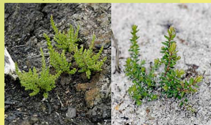
Keimende Besenheide auf der abgebrannten Heidefläche (re) und auf der abgeplaggtten Sandfläche (li)