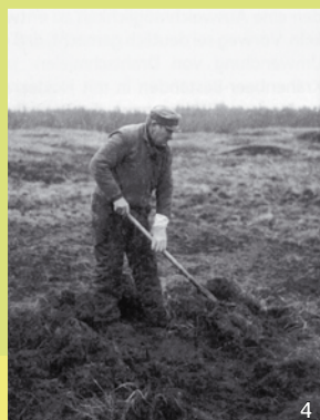
Plaggen der Heide per Hand war eine extrem mühselige Arbeit, die echte „Plackerei“.