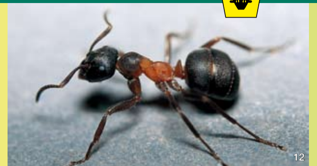
Die Uralmeise ist sehr selten und stark gefährdet.