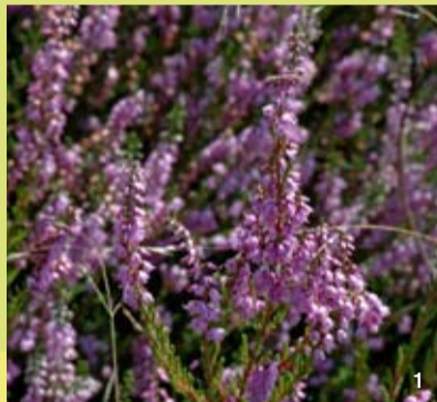
Die Besenheide ist auf dauerhafte Pflege angewiesen, da die Bestände ansonsten vergrasen oder verbuschen.

Das nordöstlich von Lütjenholm, am Rande der Soholmer Au gelegene Naturschutzgebiet „Lütjenholmer Heidedünen“ wurde bereits 1938 in einer Flächengröße von 16,6 ha unter Schutz gestellt. Ziel der Ausweisung war der Erhalt eines von Heiden bedeckten Dünenlandschaftsrestes in einem der größten Flugsand- und Binnendünengebiete der Schleswiger Vorgeest. Neben einigen wenigen anderen Schutzgebieten im weiteren Umkreis handelt es sich um eines der letzten, im Vergleich zur ehemaligen Ausdehnung winzigen Überbleibsel jener Heidelandschaft, die vor 1900 noch weite Landesteile bedeckt hatte. Nach dem Zweiten Weltkrieg konnte das Schutzgebiet nur knapp vor der Aufforstung mit Nadelgehölzen bewahrt werden. Heute ist das NSG eines der Schwerpunktgebiete des Heideschutzes in Schleswig-Holstein. Neben kleinen Heidemooren mit hochmoortypischen Pflanzenarten sind zwischen völlig vergrasteten Bereichen noch großflächig verschiedene Altersstadien besonders schutzwürdiger Trocken- und Feuchtheiden erhalten.